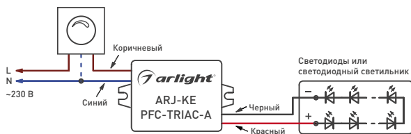
Рис. 1. Подключение источника тока.

ВНИМАНИЕ! Не допускается подключение светильника к работающему драйверу. Это может привести к отказу светильника.